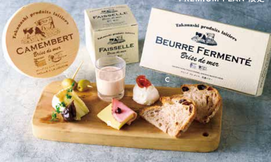
Aカマンベール B発酵バター Cフェッセル ★プレートの最後にスペシャルショットドリンクをどうぞ